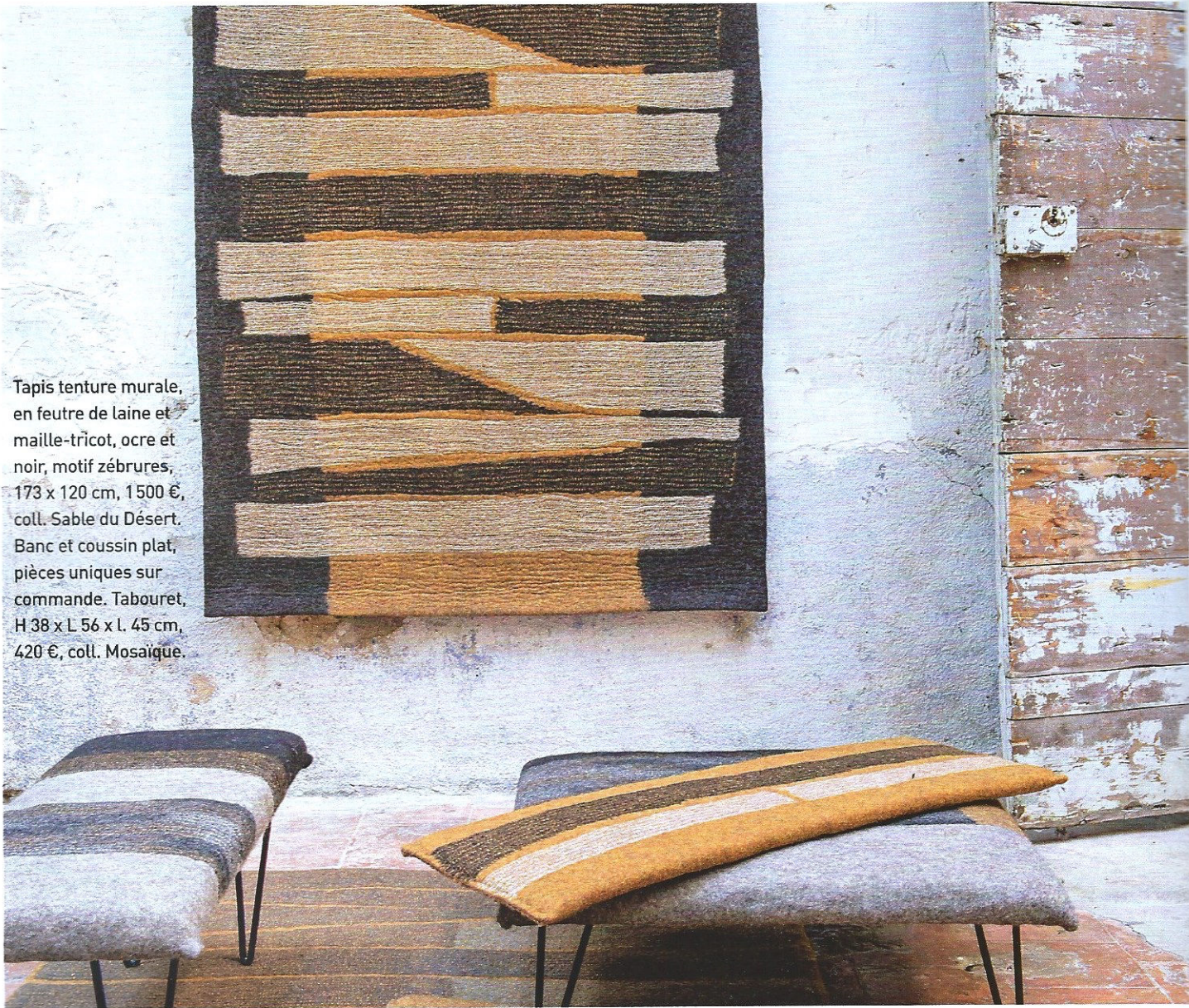
Tapis tenture murale, en feutre de laine et maille-tricot, ocre et noir, motif zébrures, 173 x 120 cm, 1 500 €, coll. Sable du Désert. Banc et coussin plat, pièces uniques sur commande. Tabouret, H 38 x L 56 x l. 45 cm, 420 €, coll. Mosaïque.