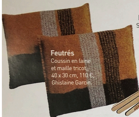
Feutrés Coussin en laine et maille tricot, 40 x 30 cm, 110 €, Ghislaine Garcin.