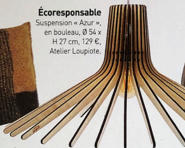
Écoresponsable Suspension « Azur », en bouleau, Ø 54 x H 27 cm, 129 €, Atelier Loupiote.