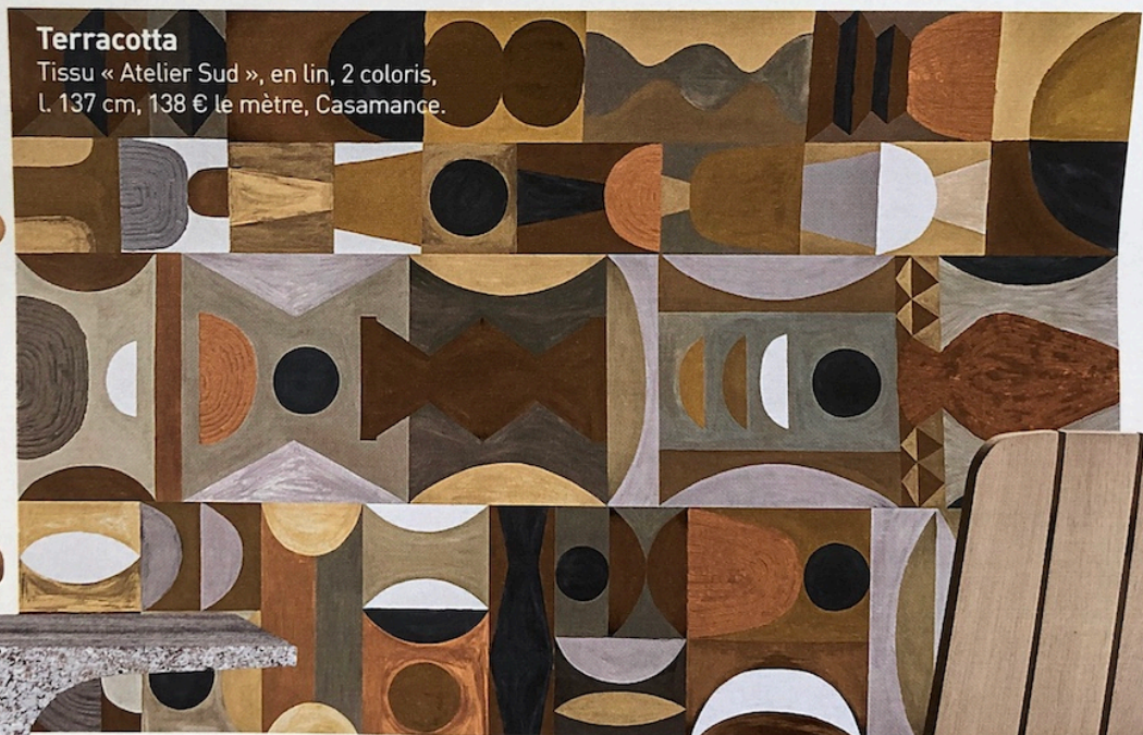
Terracotta Tissu « Atelier Sud », en lin, 2 coloris, L 137 cm, 138 € le mètre, Casamance.