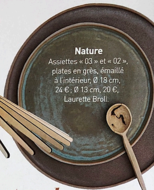
Nature Assiettes « 03 » et « 02 », plates en grès, émaillé à l'intérieur, Ø 18 cm, 24 € ; Ø 13 cm, 20 €, Laurette Broll.