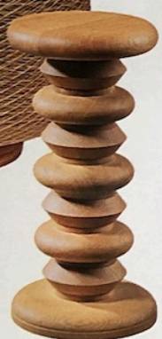
Artisanal Guéridon « Zanni », en chêne français tourné, Ø 27 x H 55 cm, 1500 €, design Studio Pinto, Pinto.