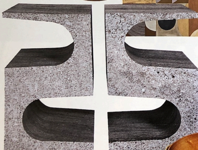
Duo Bouts de canapé « Uni », en travertin munchen, H 51 x L 30 x P 30 cm, en collaboration avec Blanc Carrare, 9550 €, Fabrice Juan.