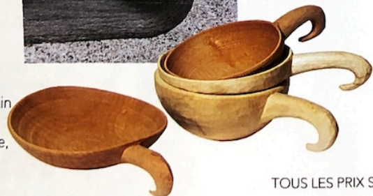
Façonnés Pochons (petites louches) en bois tourné et sculpté, en érable sycomore et prunier, L 33 cm, 210 € l'un, design Jean-Paul Rossi, La Maison de Commerce.