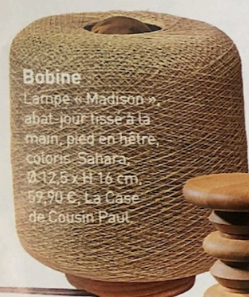
Bobine Lampe « Madison » abat-jour tissé à la main, pied en hêtre, coloris Sahara, Ø 12,5 x H 16 cm, 59,90 €, La Case de Cousin Paul.