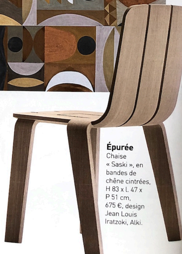
Épurée Chaise « Saski », en bandes de chêne cintrées, H 83 x l. 47 x P 51 cm, 675 €, design Jean Louis Iratzoki, Alki.